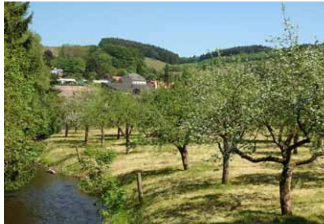
Streuobstweide im Ruwertal

Besondere Pflanzen- und Tierarten auf Halbtrockenrasen