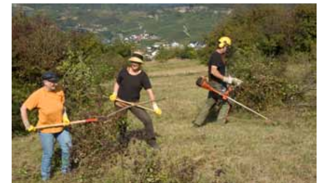
manuelle Entbuschung im Naturschutzgebiet „Langheck bei Nittel“