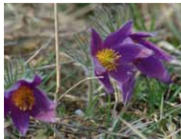
Küchenschelle am Trockenhang

Besondere Pflanzen- und Tierarten auf Halbtrockenrasen